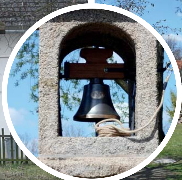
Dlouho chátrající zvonička byla konečně opravena a vybavena zvonem.