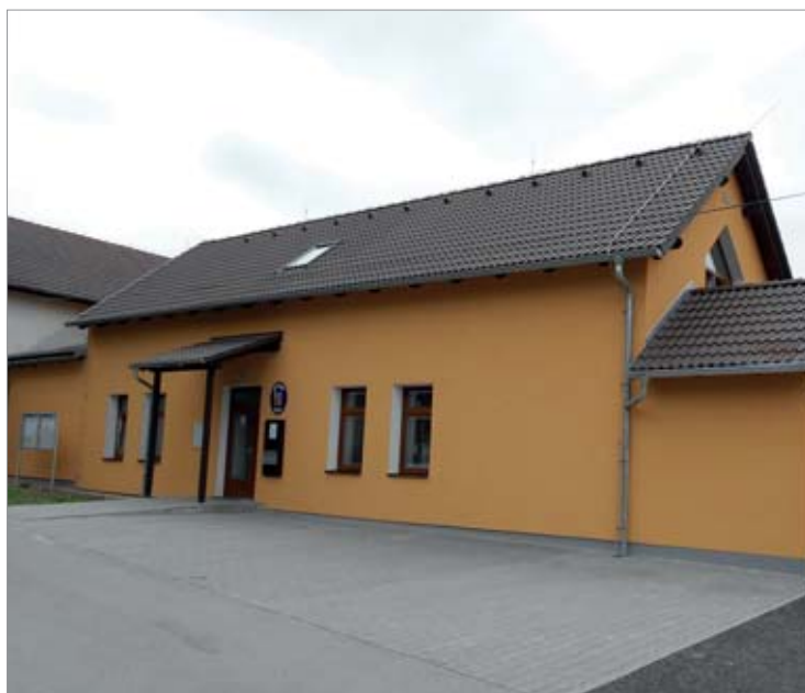
Někdejší ubytovna byla zrekonstruována a přestěhoval se do ní obecní úřad.