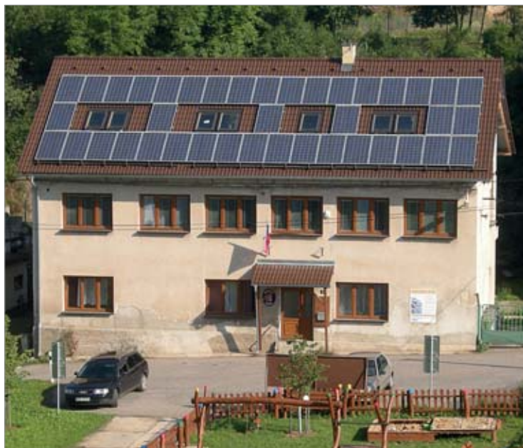
Z obecního úřadu vznikla budova základní školy, současné pýchy Ohrobce.