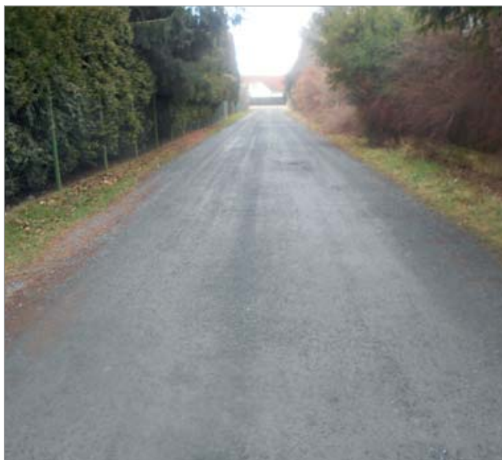
Jedna ukázka za všechny opravované silnice: Příčná ulice dostala nový povrch.