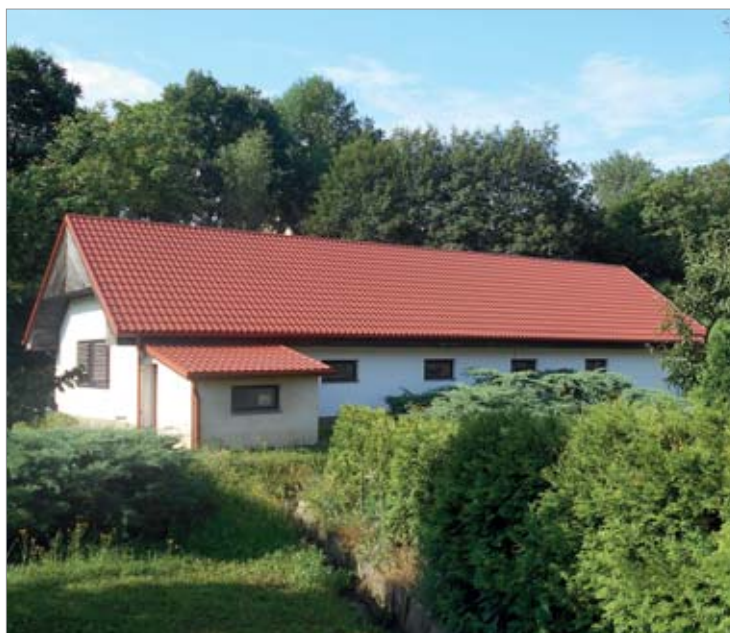
Stará, opotřebovaná a nevyhovující střecha čistíčky odpadních vod byla nahrazena novou.