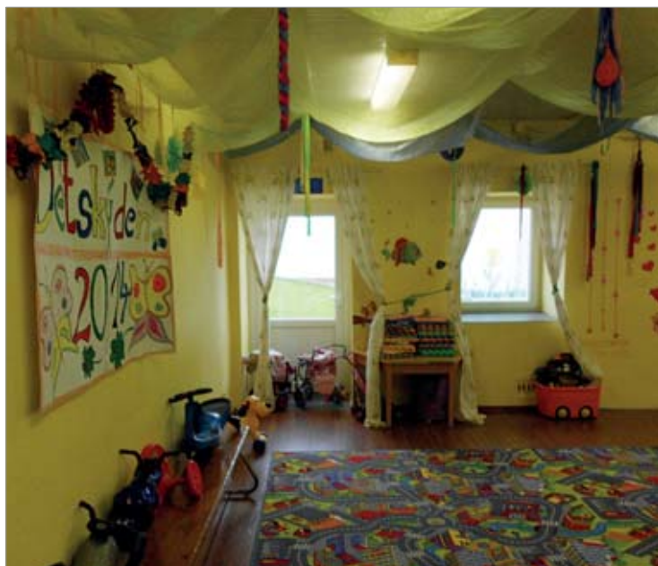
Rekonstrukce proměnila původní prostory centra Čtyřlístek ve třídu mateřské školy plnou světla, zvoucí ke hře.